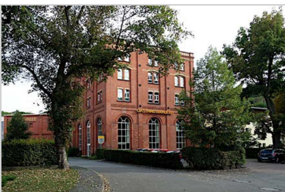
Treffpunkt für den diesjährigen Fototag: Stadtbrauerei Arnstadt