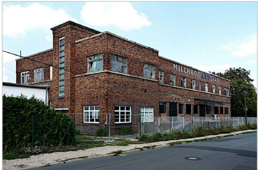
Milchhof Arnstadt , eines der wichtigsten Gebäude der Moderne in Deutschland – Ziel unserer Fotoexkursion