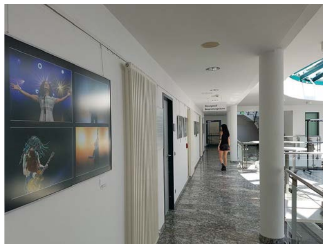
Landesfotoschau im Landratsamt Hildburghausen

Bis Anfang Oktober wird die 11. Landesfotoschau im Landratsamt Hildburghausen (Wiesenstraße 18) gezeigt. Aus diesem Anlass findet am 20. September um 19 Uhr ein Ausstellungsgespräch vor Ort statt.