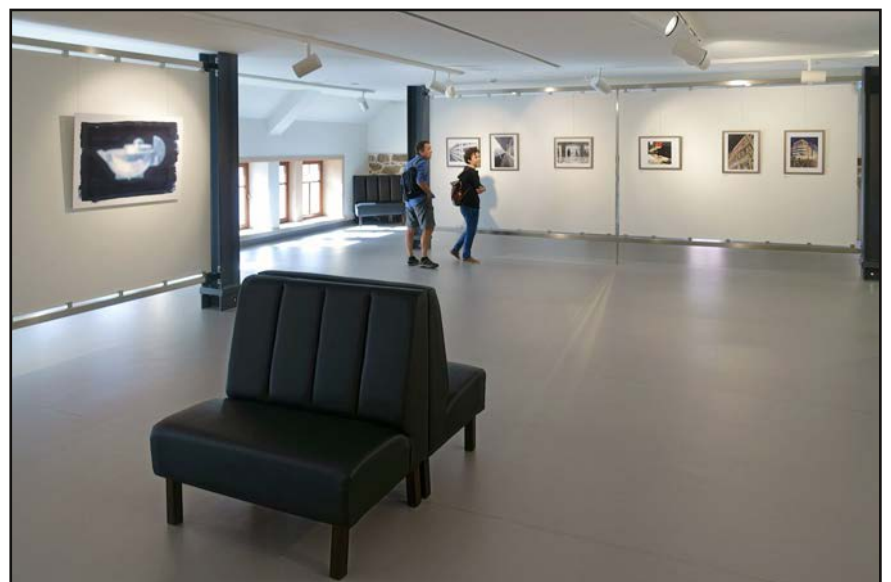
Teil der Ausstellung im KunstForum

Zur Ausstellung ist ein Katalog mit allen Fotos erschienen.