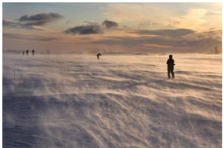
Andreas Kuhrt (Suhl): nordwärts Das Foto gehört zur 13. Landesfotoschau.