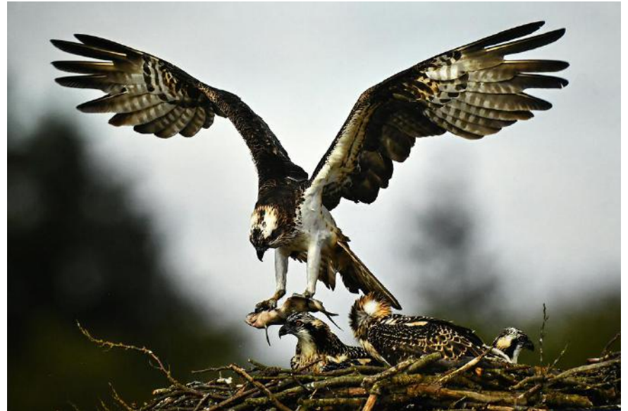
1. Platz (59 Punkte): Alfred Vogel (Fotoclub Weimar): Schon wieder Fisch ...