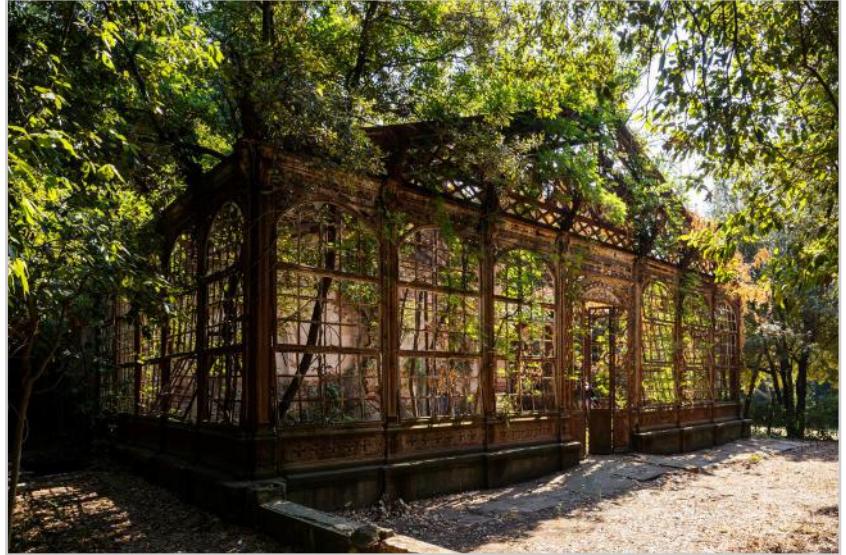
Bild aus der Ausstellung VER in Pößneck

VER – Verlassen | Vergessen | Ver- gangen